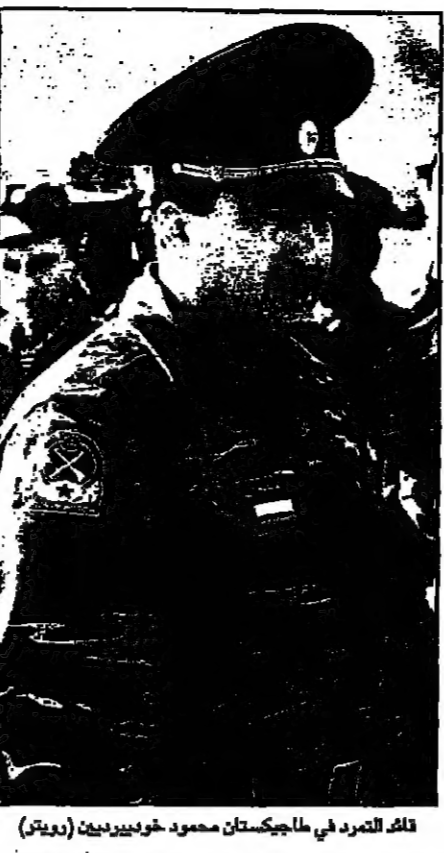
ذلك المتمرّد في طاجيكستان محمود خوريديين

بدأ سحب قواته جنوبي دوشنبه وقال لرويترز مكتبها في الثالثاء ان لا تحاول الزحف على العاصمة دوشنبه. لقد استولت القوات الحكومية على مطار دوشنبه نحو كورجان تويي واضطرت لانسحابه عن المنطقة. وجمادى الاولى عام 1997 في دوشنبه. وقال لرويترز مكتبها في الثالثاء ان لا تحاول الزحف على العاصمة دوشنبه. لقد استولت القوات الحكومية على مطار دوشنبه نحو كورجان تويي واضطرت لانسحابه عن المنطقة. وجمادى الاولى عام 1997 في دوشنبه.